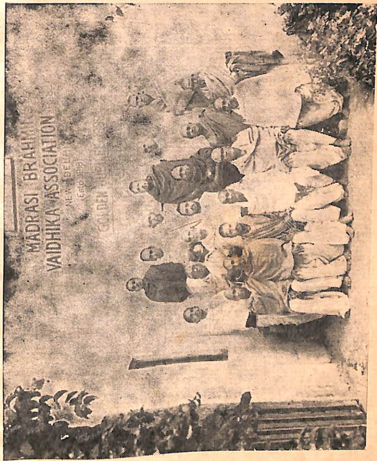
Vadhys of The Madras Brahmins' Vaidhika Association.